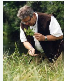
LE GUÉRISSEUR DE CHATILLON

Les guérisseurs et leurs traitements qui, par le passé (pas si lointain), étaient traqués dans de grandes chasses aux sorcières, par les instances publiques et le corps médical, sont à présent montrés comme une