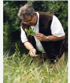
LE GUÉRISSEUR DE CHATILLON

Tous ces supports, ces stages, cette association, ne peuvent fonctionner sans votre participation sous quelque forme que ce soit. Que chacun participe à sa façon, c'est le point fort de notre association; certains participent aux stages, d'autres les encadrent, d'autres gèrent l'aspect logistique, d'autres la partie restauration, d'autres encore, l'as-