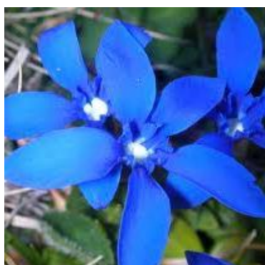
Etoile Céleste, fierté de la Savoie

« La richesse de la flore locale a été grandement appréciée ... »