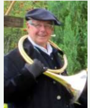
A Novel, Hte Savoie, le temps ne compte pas.

Que cette période hivernale soit pour chacun un temps de réflexion sur les temps d'une vie, sur les points essentiels que nous voudrions mettre au grand jour, sur les œuvres inachevées qui ne demandent qu'à deve-